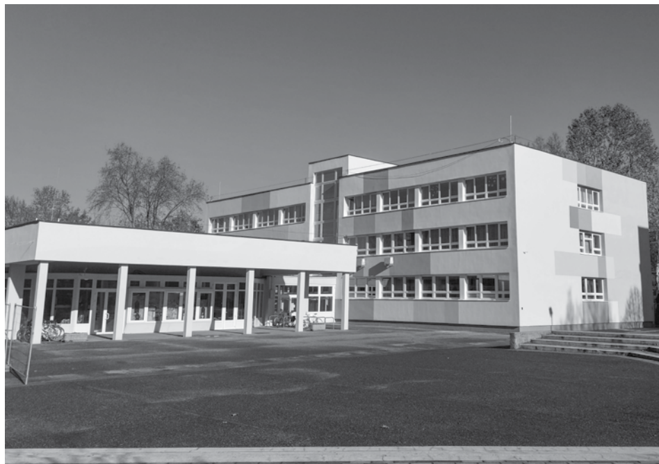
A Kovács Margit iskola épülete 2022-ben