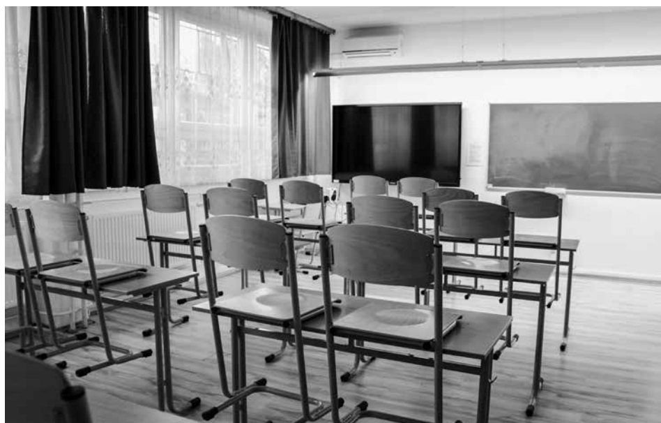
A Kovács Margit iskola tanterme