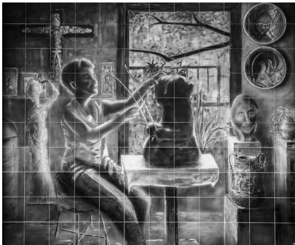
Kovács Margitot ábrázoló csempekép a színházterem hátsó falán. Az intézmény 1992-ben vette fel a győri születésű keramikus nevét