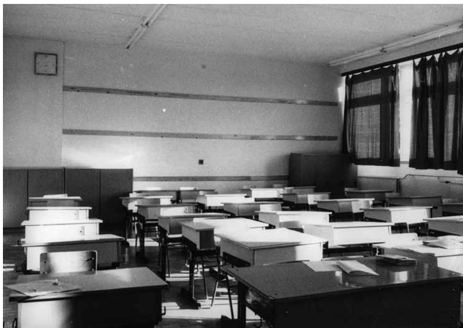
Tanterem kialakítása a Balázs Béla ÁMK épületében