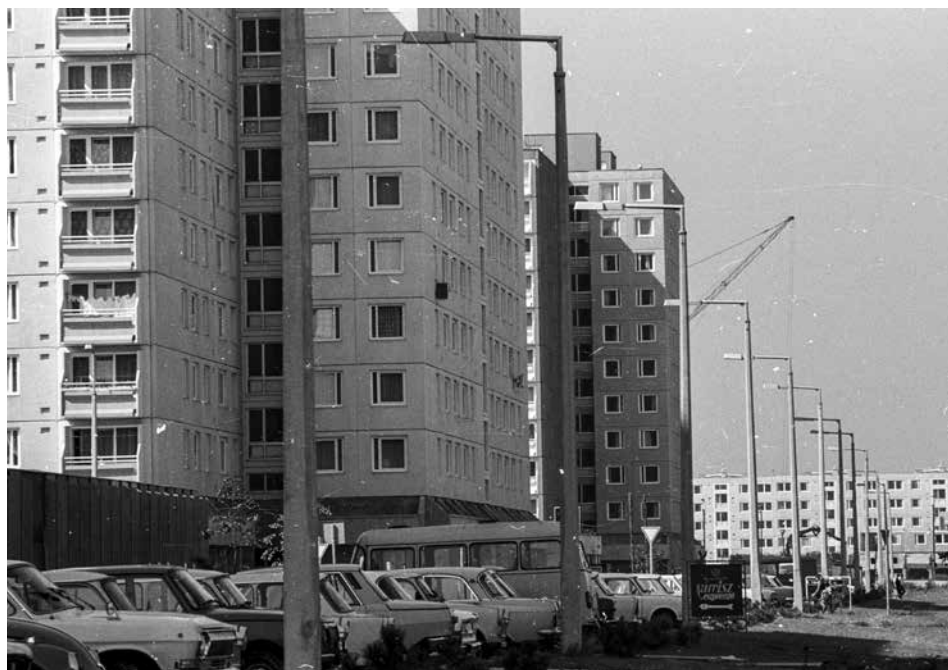
Marcalváros I., a Lajta út a Répce utca felől 1987-ben