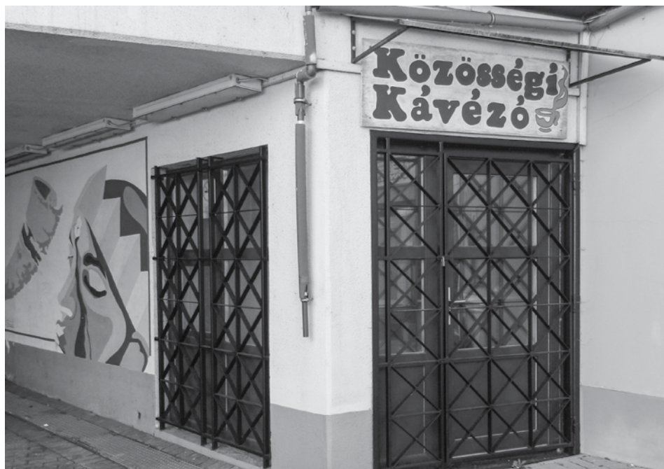
A Marcalvárosi aluljáróban 2014-ben nyílt meg a Közösségi Kávézó, jelenleg Advvárosban működik