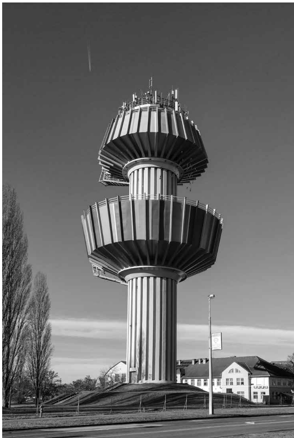
Marcalvárosi Víztorony 2022-ben