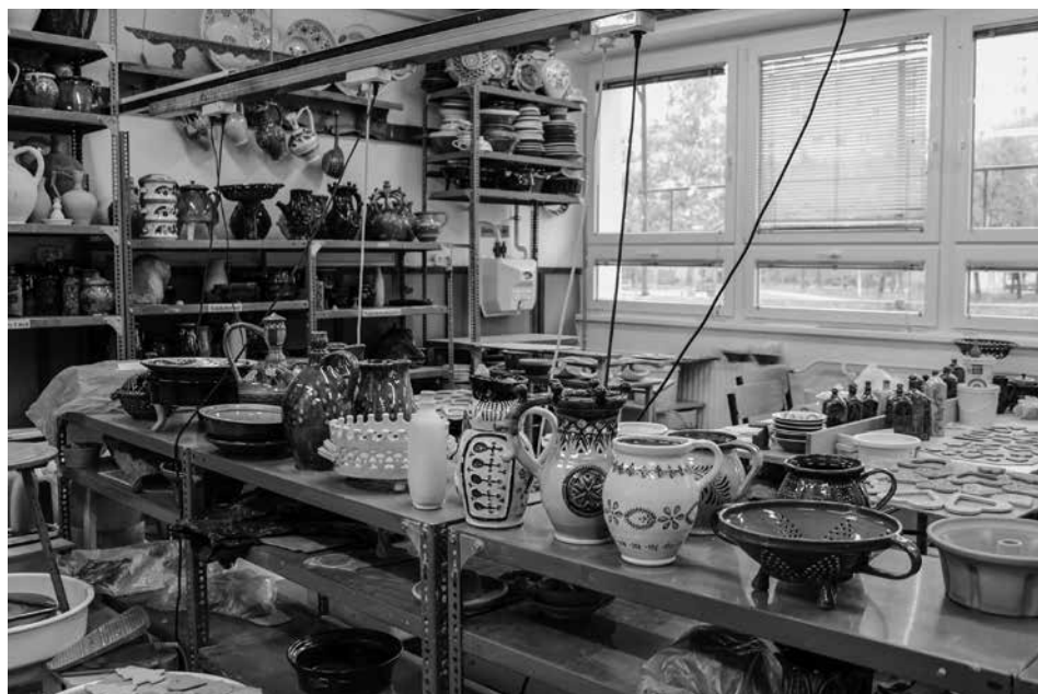
Az iskola fazekas műhelye