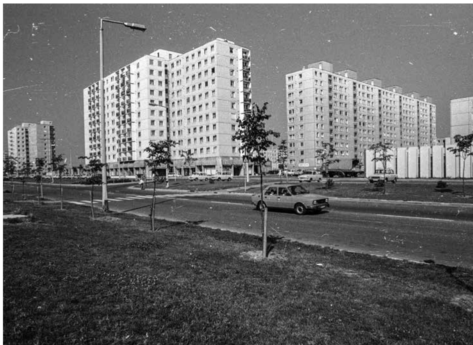
Marcalváros I., a Lajta út 1987-ben