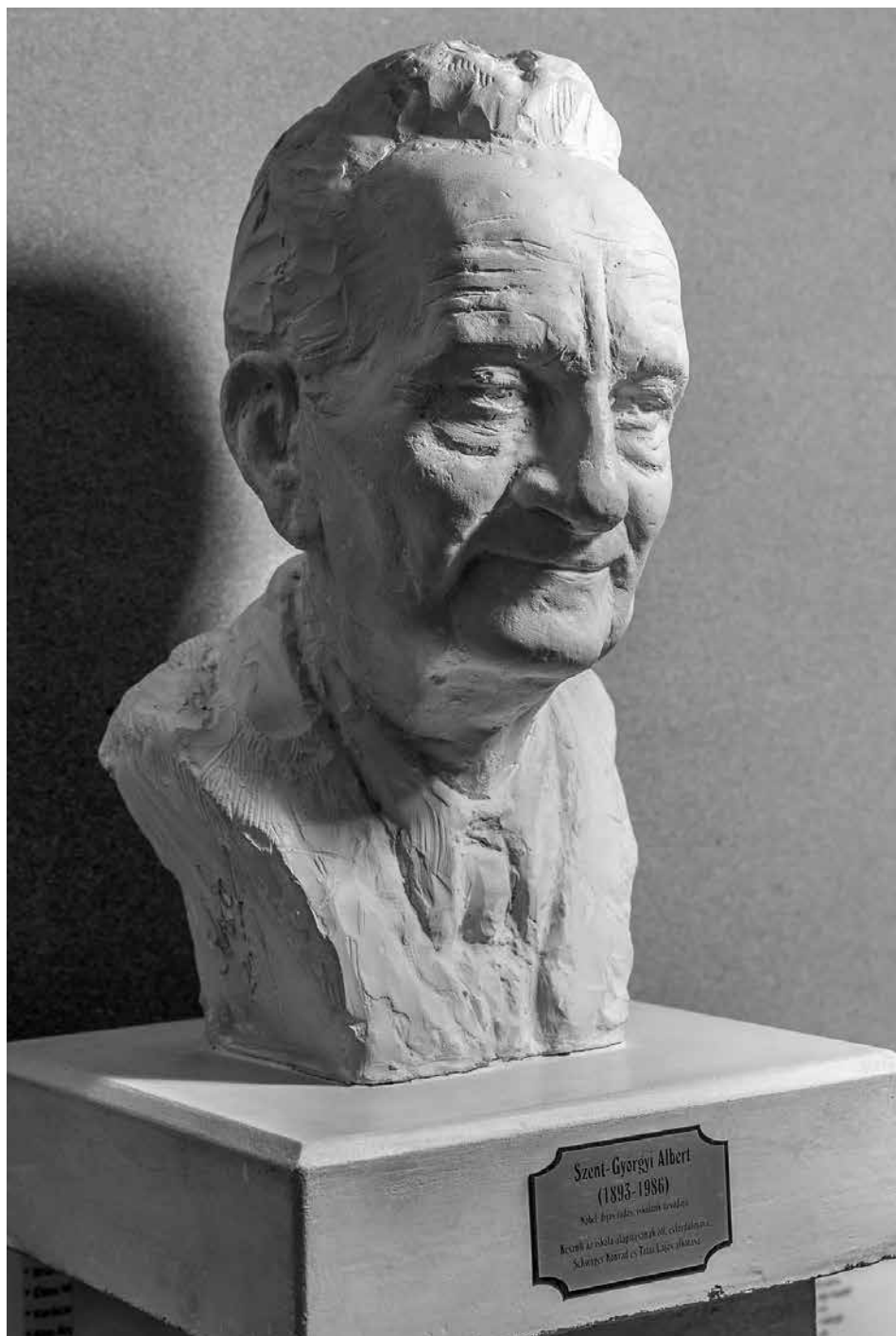
Szent-Györgyi Albert fejszobra az iskola aulájában