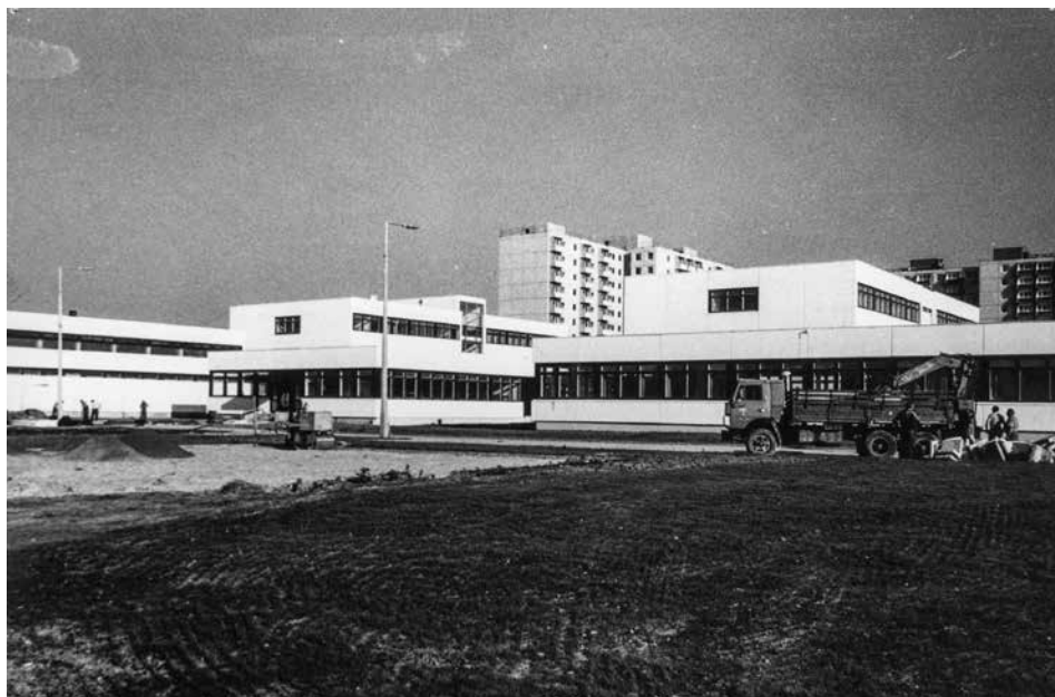
A Balázs Béla ÁMK építése 1985-ben – ebben az épületben működik ma a PÁGISZ