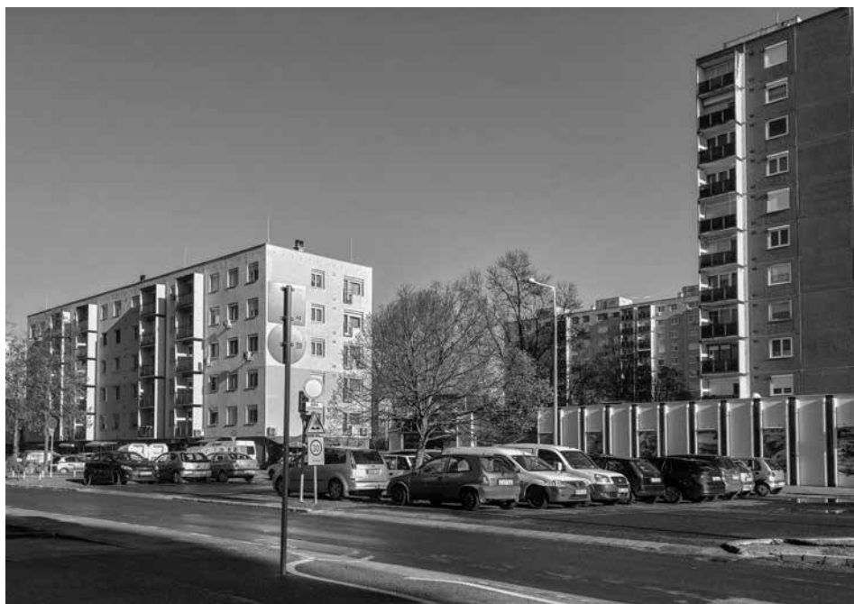
Utcakép Marcalvárosból, Lajta út és Répce utca sarok 2022-ben