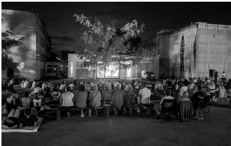
Marcalvárosi Mozi a Kovács Margit iskola előtti téren, a Dr. Kovács Pál Könyvtár és Közösségi Tér szervezésében 2022-ben