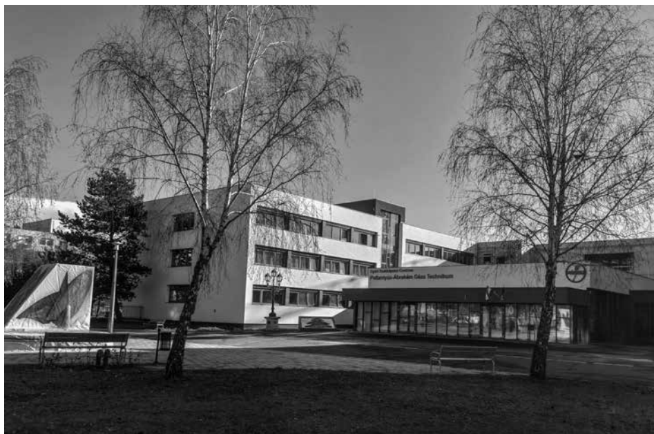
A Pattantyús-Ábrahám Géza Technikum épülete 2022-ben