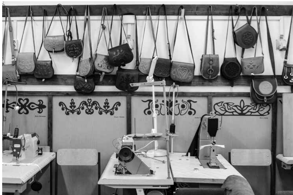
Az iskola bőrső mőhelye