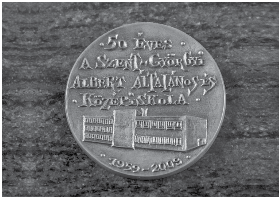
Az 50. évfordulóra készült bronzérmén még a régi épület (Bácsai út 55.) képe látható