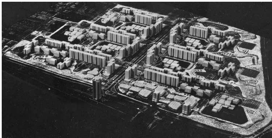
A Kun Béla lakótelep beépítési terve VB által jóváhagyva 1974 A Dr. Kovács Pál Könyvtár és Közösségi Tér saját gyűjteményéből