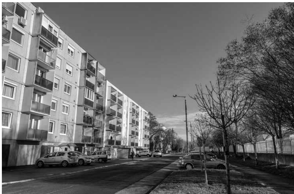
Utcakép Marcalvárosból, Lomnic utca 2022-ben