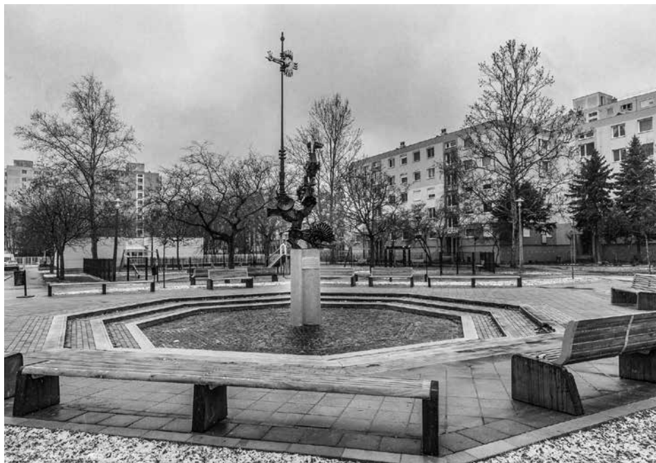
Az iskola előtti téren álló „Égtájjelző” szobor, háttérben a játszótér és az óvoda