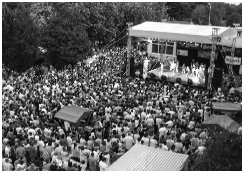
Győri Búcsú 2008 Hatos Hajnalka igazgató asszony engedélyével - PÁGISZ