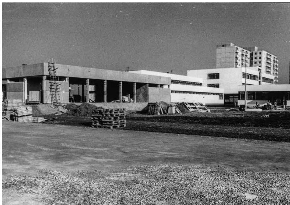
A Balázs Béla ÁMK építése 1985-ben – ebben az épületben működik ma a PÁGISZ