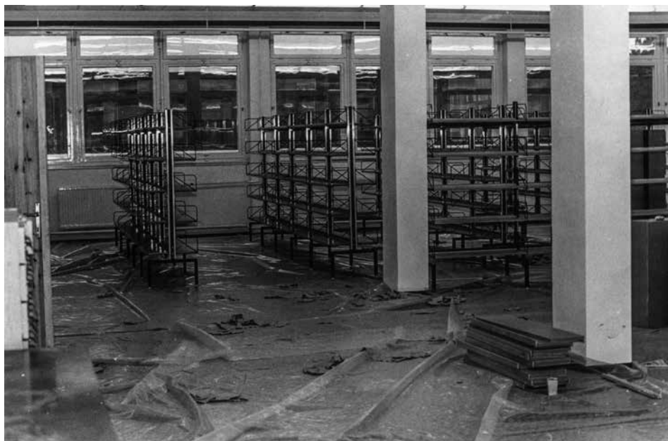
Könyvtár kialakítása a Balázs Béla Általános Iskola és ÁMK épületében