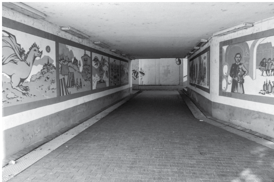
A Marcalvárosi aluljárót 2012 óta fiatal győri művészek alkotásai díszítik