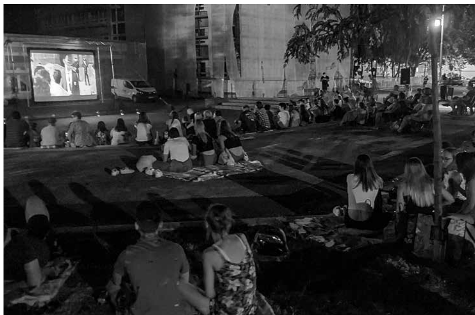
Marcalvárosi Mozi a Kovács Margit iskola előtti téren, a Dr. Kovács Pál Könyvtár és Közösségi Tér szervezésében 2022-ben