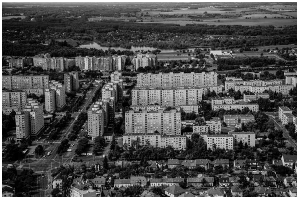
Marcalváros I. távlati képe