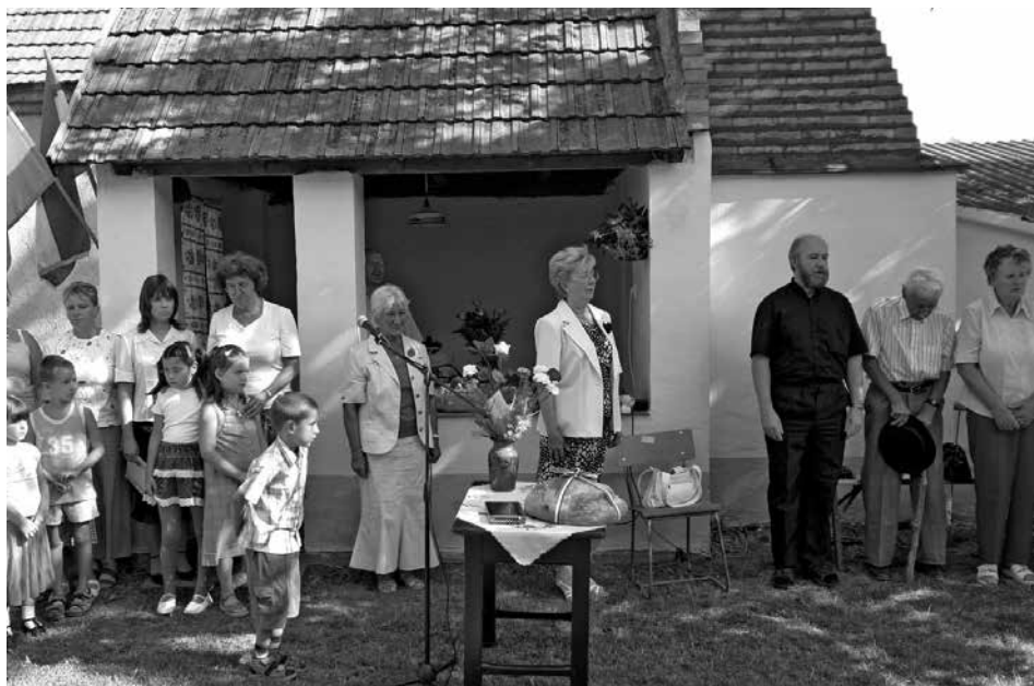
Augusztus 20-i rendezvény a Kincsház udvarán