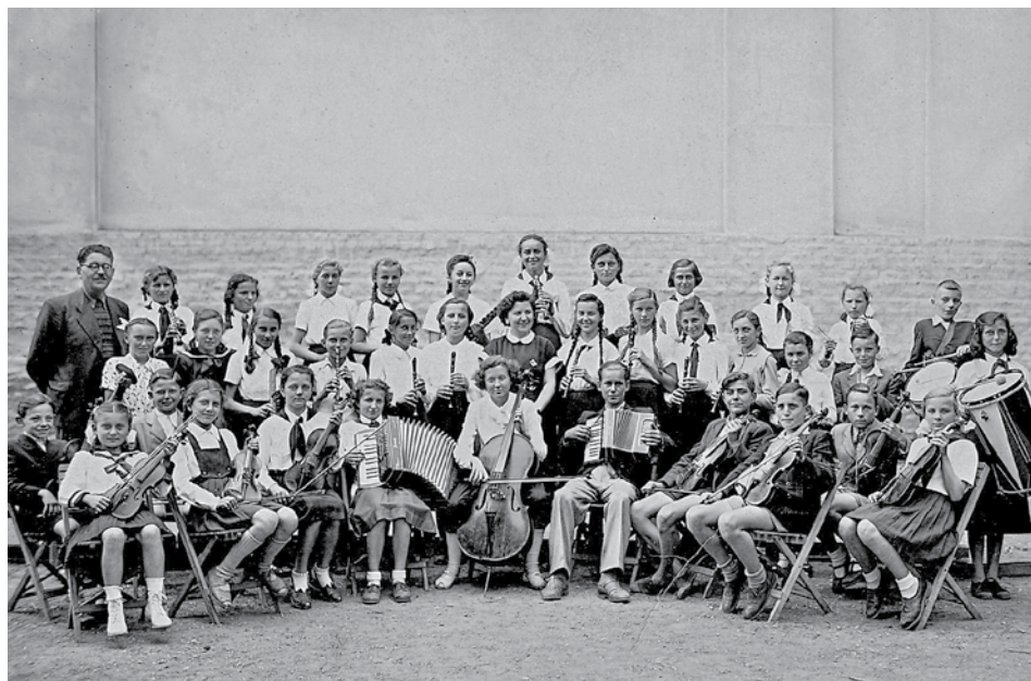
Iskolai zenekar az 1950-es években