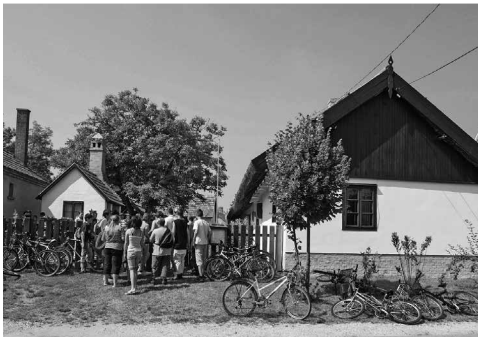
A Kincsház utcai homlokzata az Ősi utcában