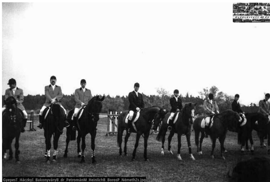
Sent-Juán Lovassport Egyesület