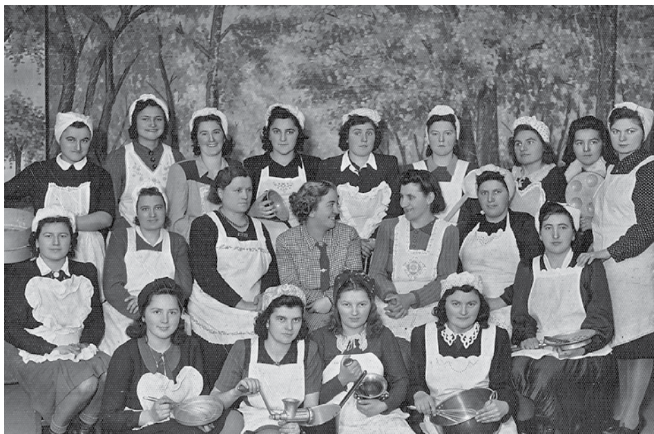
Főzőtanfolyam résztvevői az 1940-es évek elején