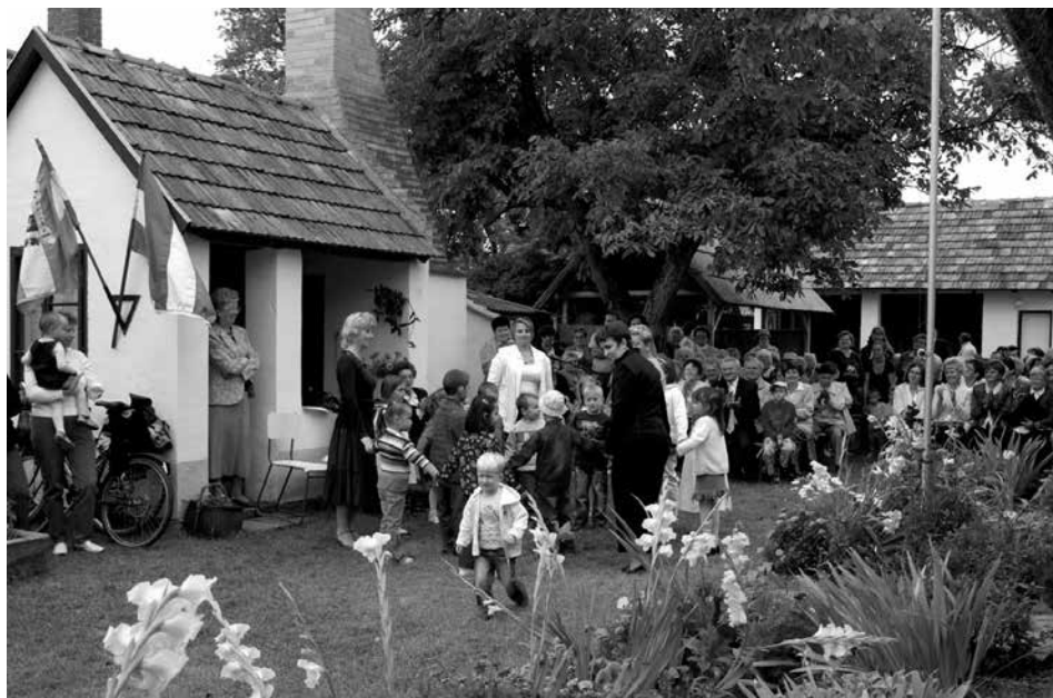
Óvodások fellépése a Kincsház udvarán