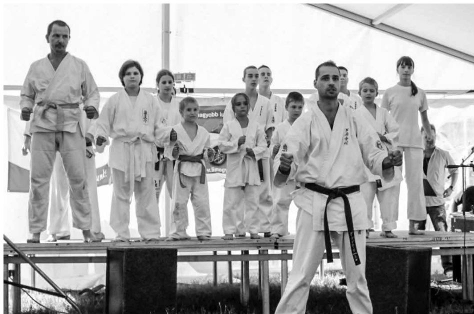
Likócsi Ashihara Klub