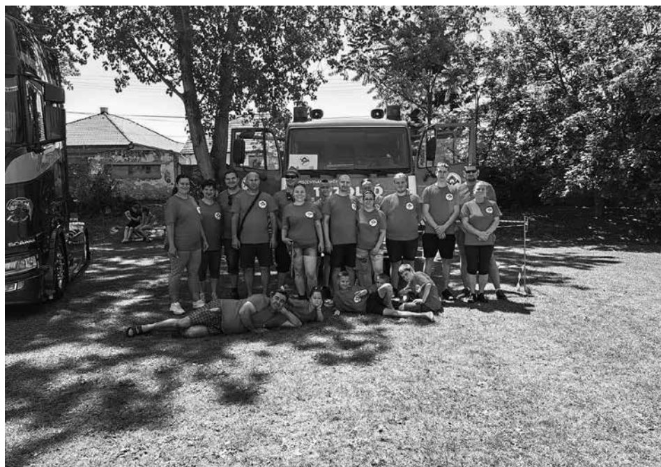
Gyórszentiváni Önkéntes Tűzoltó Egyesület