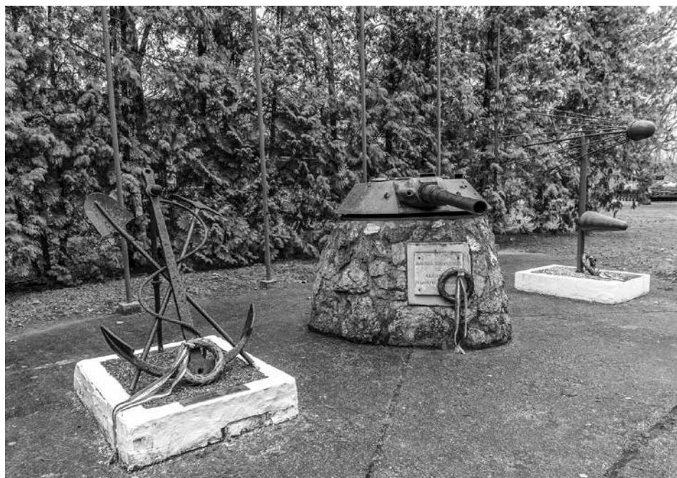
Likócs. A MH 12. Arrabona Légvédelmi Rakétaezred emlékparkja