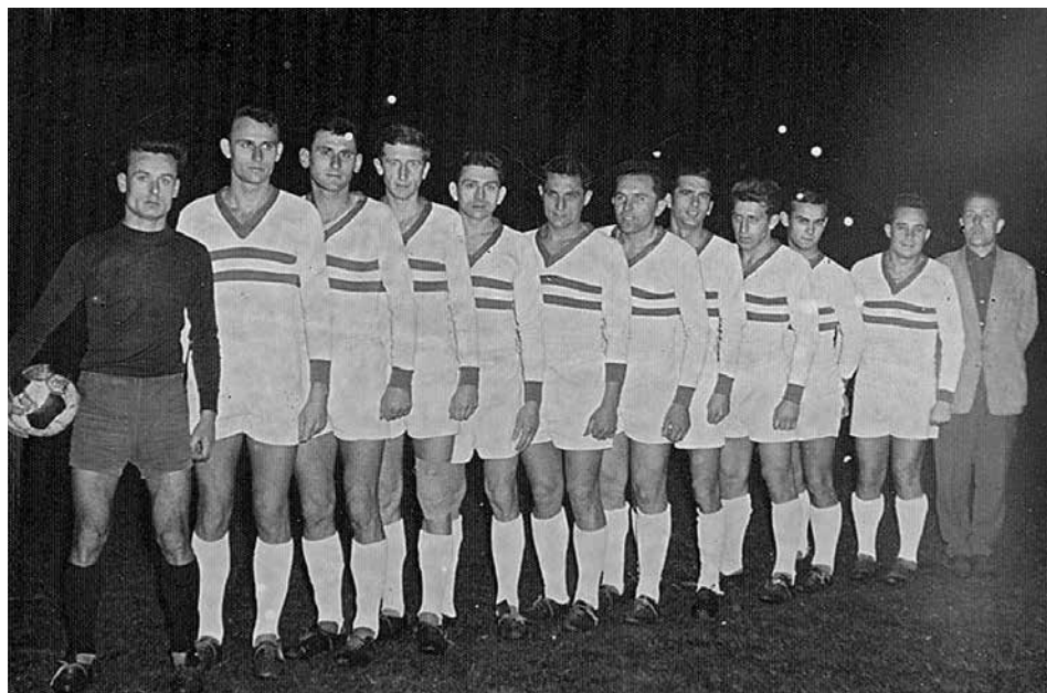
Az 1960-as évek „aranycsapata”