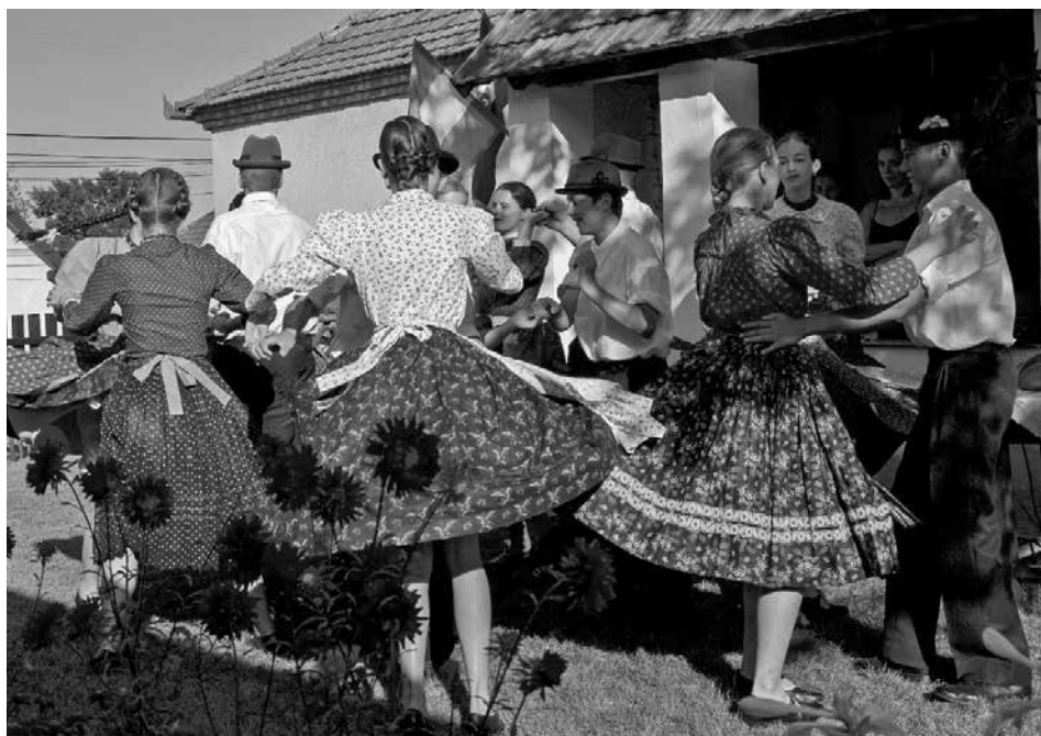
A Cserók Néptáncgyűttes a Kincsház udvarán (fotó: Molnár Vid Közösségi Ház)