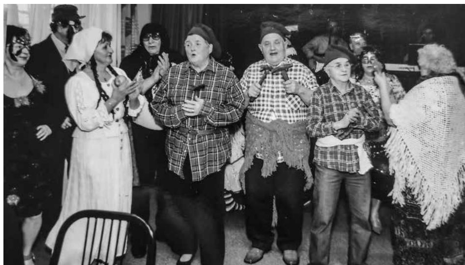
Az Aranyeső klub farsangi mulatsága