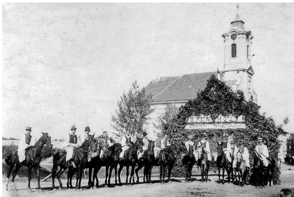
A főpásztor ünnepélyes fogadtatása a győrszentiváni lovasbandériummal az 1930-as években