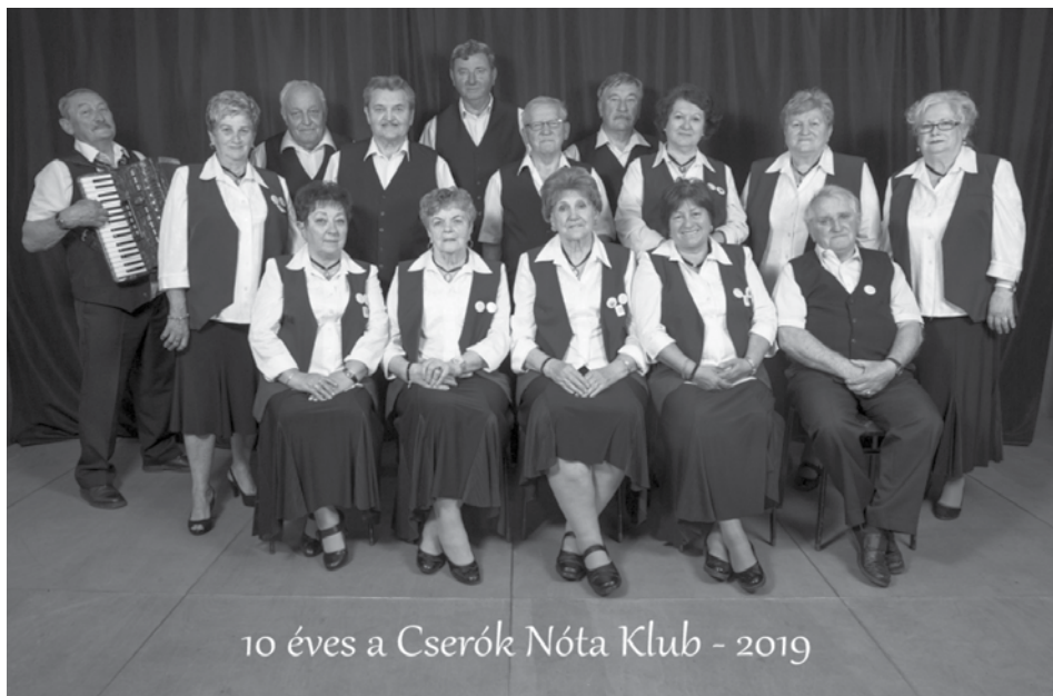
Cserók Nótaklub tízéves fennállásuk idején, 2019-ben