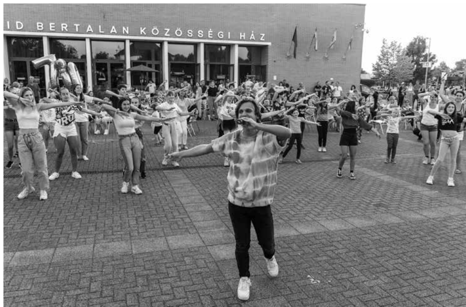
Molnár Vid Községi Ház előtti tér gyakran ad helyet rendezvényeknek