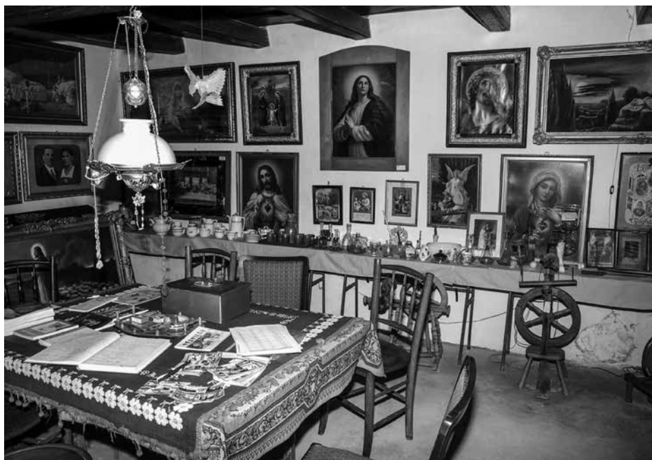
Részlet a Kincsház szobájáról