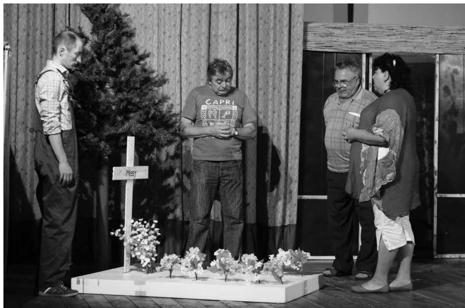
Részlet Genesisus Színjátszókör előadásából