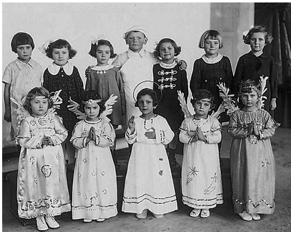
Karácsonyi játék szereplői 1925 körül