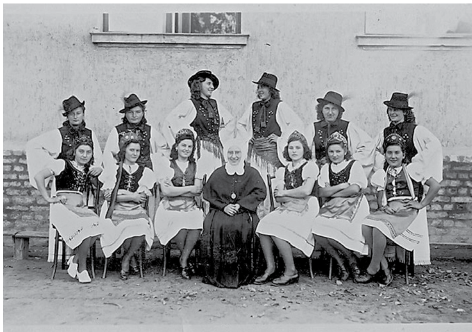
A zárdaiskola tanulói magyarruhában az Isteni Szeretet Leányai Rend apácájával