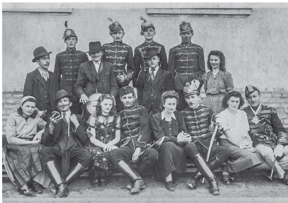
A „Csókos huszárok” szereplői 1943 áprilisában