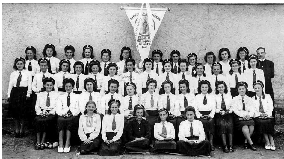
Dolgozó Leányok egyesülete az 1940-es évek elején