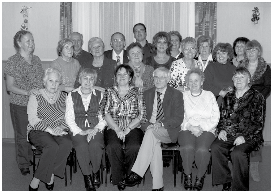
Az Irodalmi Szalon tagjai (fotó: Molnár Vid Községi Ház)