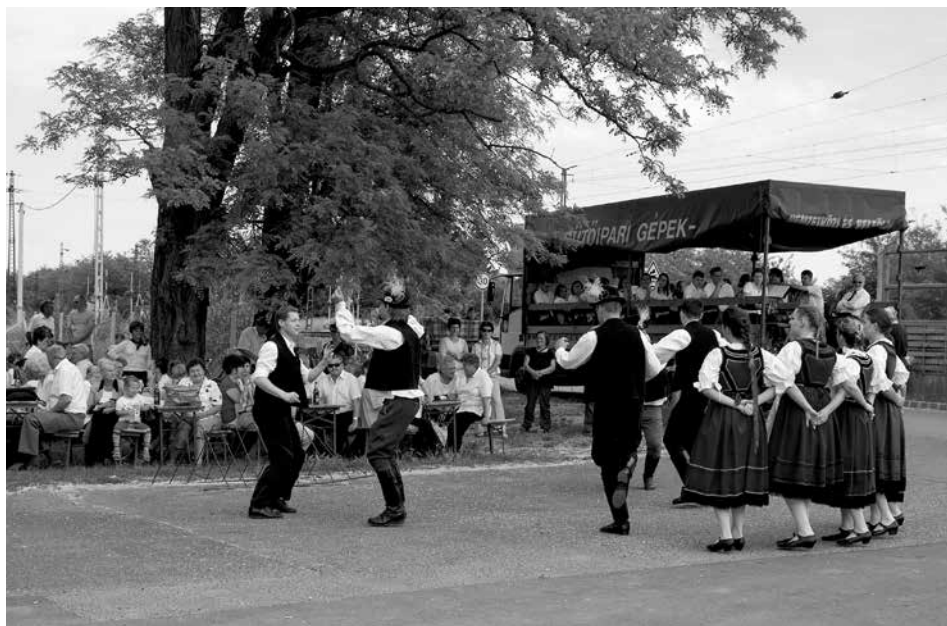
Cserók néptáncgyűttes fellépése a Szentiváni Szüreti Napokon