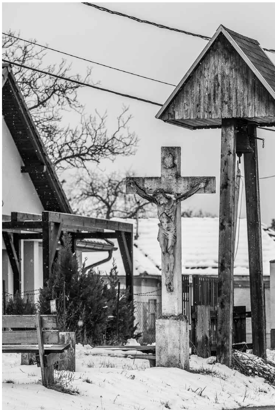
Likócs, Római út. Temetőkereszt és harangláb