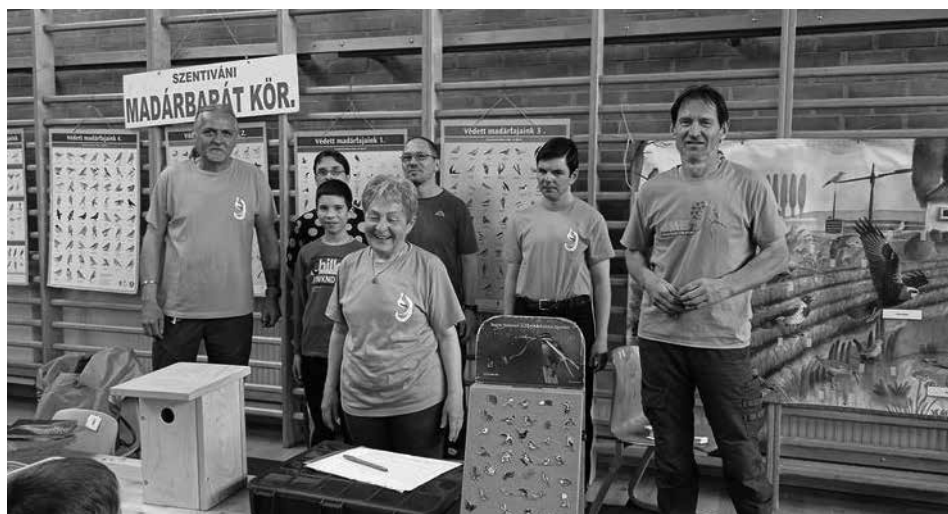
A Szentiváni Madárbarát Kör bemutatkozása