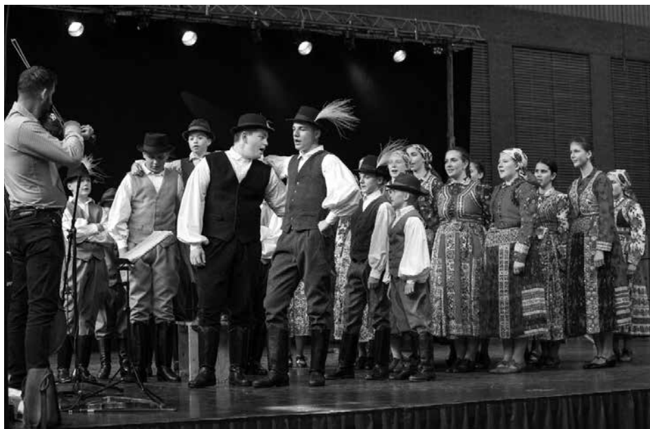
Cserók Néptáncgyűttes a közösségi ház színpadán